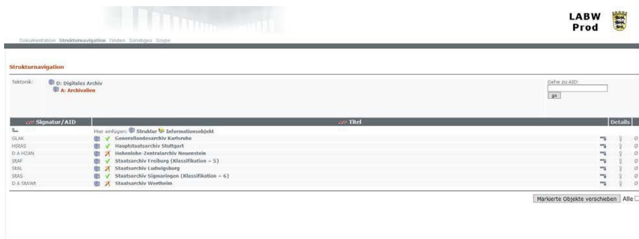
Abb. 1: DIMAG Kernmodul

Das Akronym DIMAG steht für „Digitales Magazin“. DIMAG wird derzeit von einer Vielzahl staatlicher Archive und von über einhundert Archiven von Kommunen, Hochschulen und Kirchen in Deutschland, Österreich und der Schweiz eingesetzt. Diese Archive teilen sich die Arbeit an der kooperativen Weiterentwicklung von DIMAG.